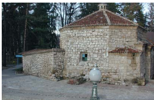
Slika 1. Tursko kupatilo Amam (foto A. Radivojević, 2005.)

Tursko kupatilo "Amam" nalazi se u centralnom banjskom parku, sa kadamu koju je koristio još knez Miloš. Materijalni tragaovi (fragmenti antičkih opeka) svedoče o tome da, kupatilo potiče još iz perioda Rimljana. Za manja kupatila, koja se nalaze u sklopu Amama, utvrđeno je da su građena u doba vladavine Turaka. Kupatilo Amam je više puta, u svojoj novijoj istoriji, restaurirano, kako bi zadržalo svoj prvobitni oblik, istorijsku vrednost, turističku atraktivnost i zdravstveno-lečilišnu funkcionalnost.